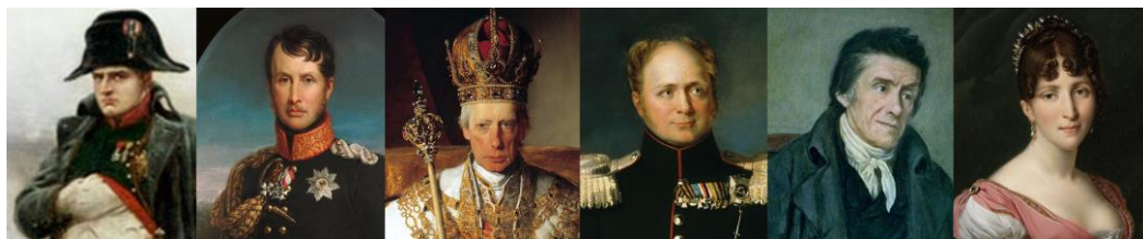
Napoléon Bonaparte – König Friedrich Wilhelm III. von Preussen – Kaiser Franz I. von Österreich – Zar Alexander I. von Russland – Heinrich Pestalozzi – Hortense de Beauharnais, Ex-Königin von Holland und Mutter von Napoléon III.