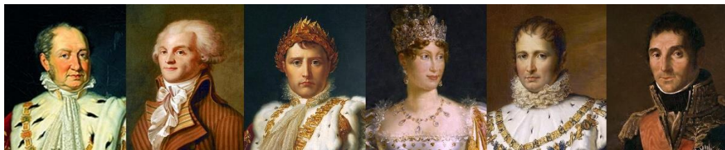
König Maximilian I. Joseph von Bayern – Revolutionsführer Maximilien de Robespierre – Kaiser Napoléon Bonaparte – französische Kaiserin Marie-Louise (von Österreich) – König von Italien und von Spanien Joseph I. Bonaparte – Marschall André Masséna